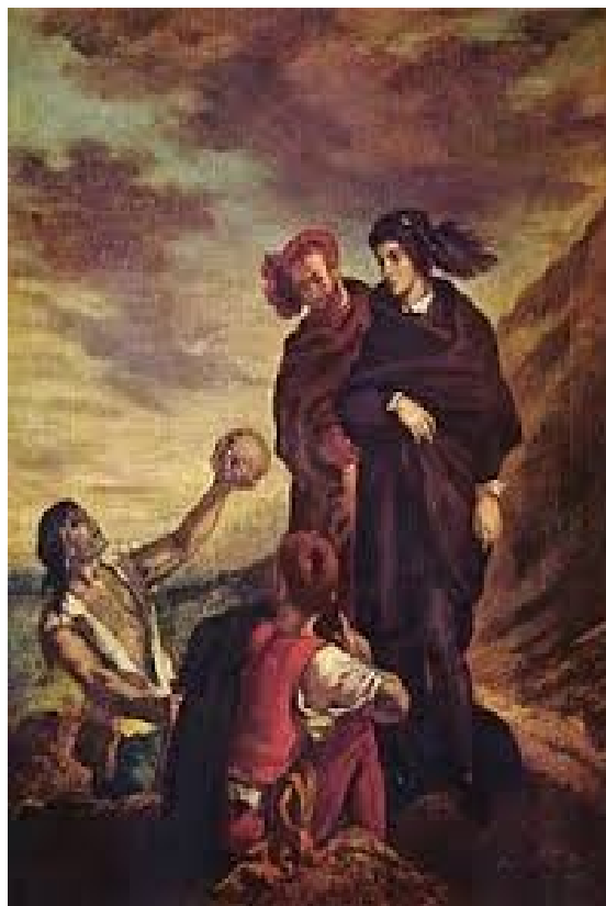
Hamlet z Horacym na cmentarzu , Eugène Ferdinand Victor Delacroix, 1839

Przyjaciel Hamleta. Jedyny człowiek, towarzyszący Hamletowi w każdej chwili, nawet w rozterkach, szałach, przygnębieniu królewicza. Horacy jest wierny Hamletowi, nie snuje domysłów nad przemianą głównego bohatera, nie spiskuje z nikim. Wypowiedzi Horacego są krótkie, rzeczowe, zawsze dają jasny ogląd sytuacji i trzeźwe sądy. Horacy często pełni rolę jakby dobrego ducha, strzegącego Hamleta. Spełnia też w tym królewski nakaz opieki nad młodym królewiczem.