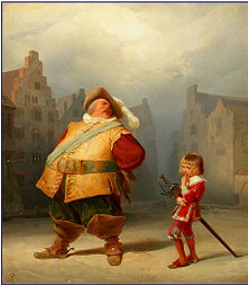
Falstaff i jego paź , Adolf Schrödter, 1867

Falstaff (właściwie Sir John Falstaff ) – fikcyjna postać pojawiająca się w trzech sztukach Williama Szekspira jako kompan przyszłego króla Henryka V, syna Henryka IV. Otyły, niesławny i tchórzliwy rycerz często sprawia przyszłemu królowi kłopoty, a po tym, jak ten wstępuje na tron, zostaje niespodziewanie odrażony. Postać często występująca w literaturze europejskiej jako Miles Gloriosus lub Żołnierz Samochwał .