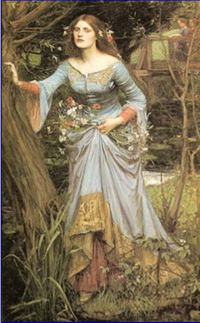
Ofelia , John William Waterhouse, 1910

Ofelia – postać fikcyjna, bohaterka sztuki Williama Szekspira "Hamlet", córka Poloniusza, siostra Laertesza, ukochana Hamleta, dwórka króla Danii.