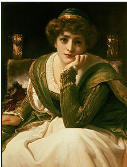
Desdemona , Federic Leighton, 1888

Desdemona – postać fikcyjna z tragedii Szekspira Otello . Wenecjanka, córka senatora, żona tytułowego bohatera. Pozostaje wierna i lojalna wobec męża, jednak ten, za sprawą intrygi, podejrzewa ją o cudzołóstwo.