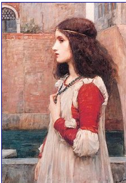
Niebieski naszyjnik - Julia , John William Waterhouse, 1898

Julia Kapulet , także Julia Capuleti - fikcyjna postać z tragedii pod tytułem Romeo i Julia . W pierwszych wydaniach tego utworu jej imię brzmiało Julietta