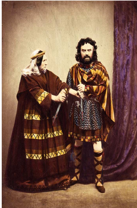
Angielski aktor Charles Kean wraz z żoną jako Makbet i Lady Makbet, 1858 rok

Makbet – bohater tragedii Williama Szekspira napisana około roku 1606 należy do najczęściej wystawianych i adaptowanych sztuk szekspirowskich, jest również najkrótszą tragedią jego autorstwa.