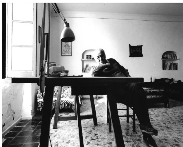
Pisarz w neapolskim mieszkaniu

Gustaw Herling-Grudziński był laureatem nagród: "Kultury" (1958), Jurzykowskiego (1964), Kościelskich (1966), "Wiadomości" (1981), włoskiej nagrody Premio Viareggio, międzynarodowej "Prix Gutenberg" i francuskiego Pen-Clubu. Był doktorem Honoris Causa Uniwersytetu Jagiellońskiego i Uniwersytetu Adama Mickiewicza w Poznaniu.