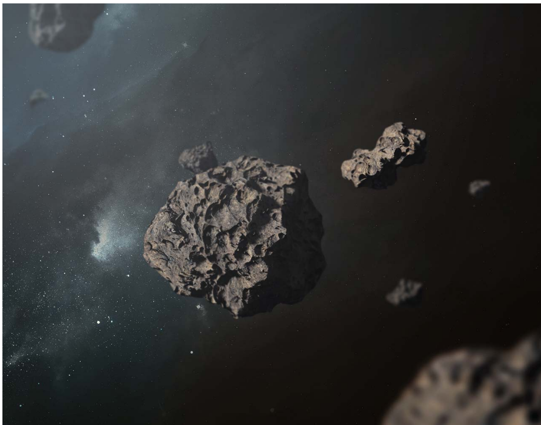
Lem w kosmosie

Lem został też uhonorowany w inny sposób.