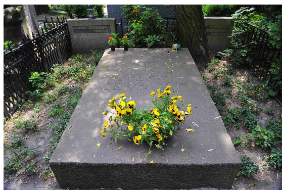
Mogiła Stefana Żeromskiego na Cmentarzu Ewangelickim w Warszawie