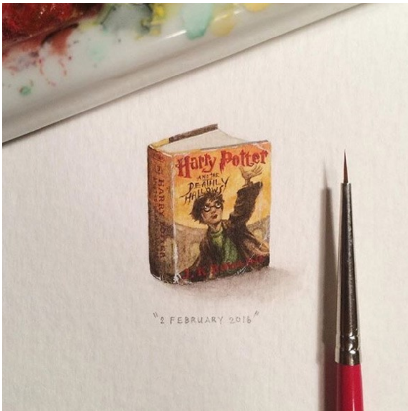
Harry Potter i insygnia śmierci Joanne Rowling