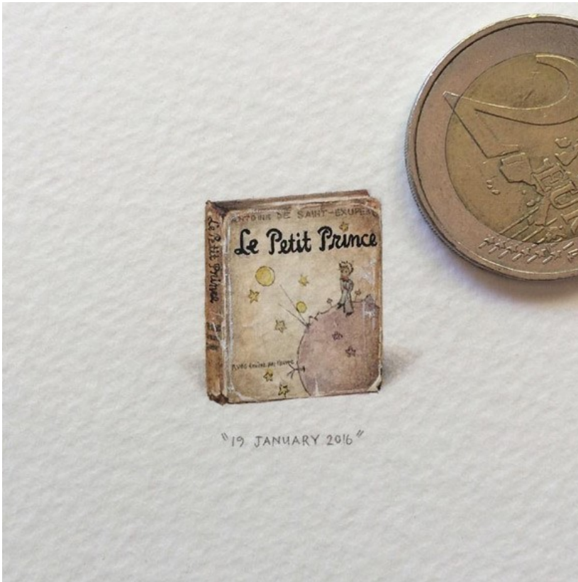
Mały Książę Antoine de Saint-Exupéry